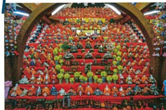
阿下喜のおひなさん